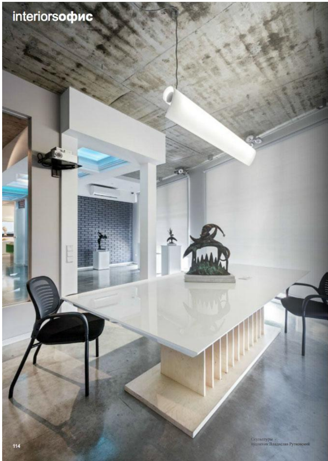
Скульптуры художник Владислав Рутковский