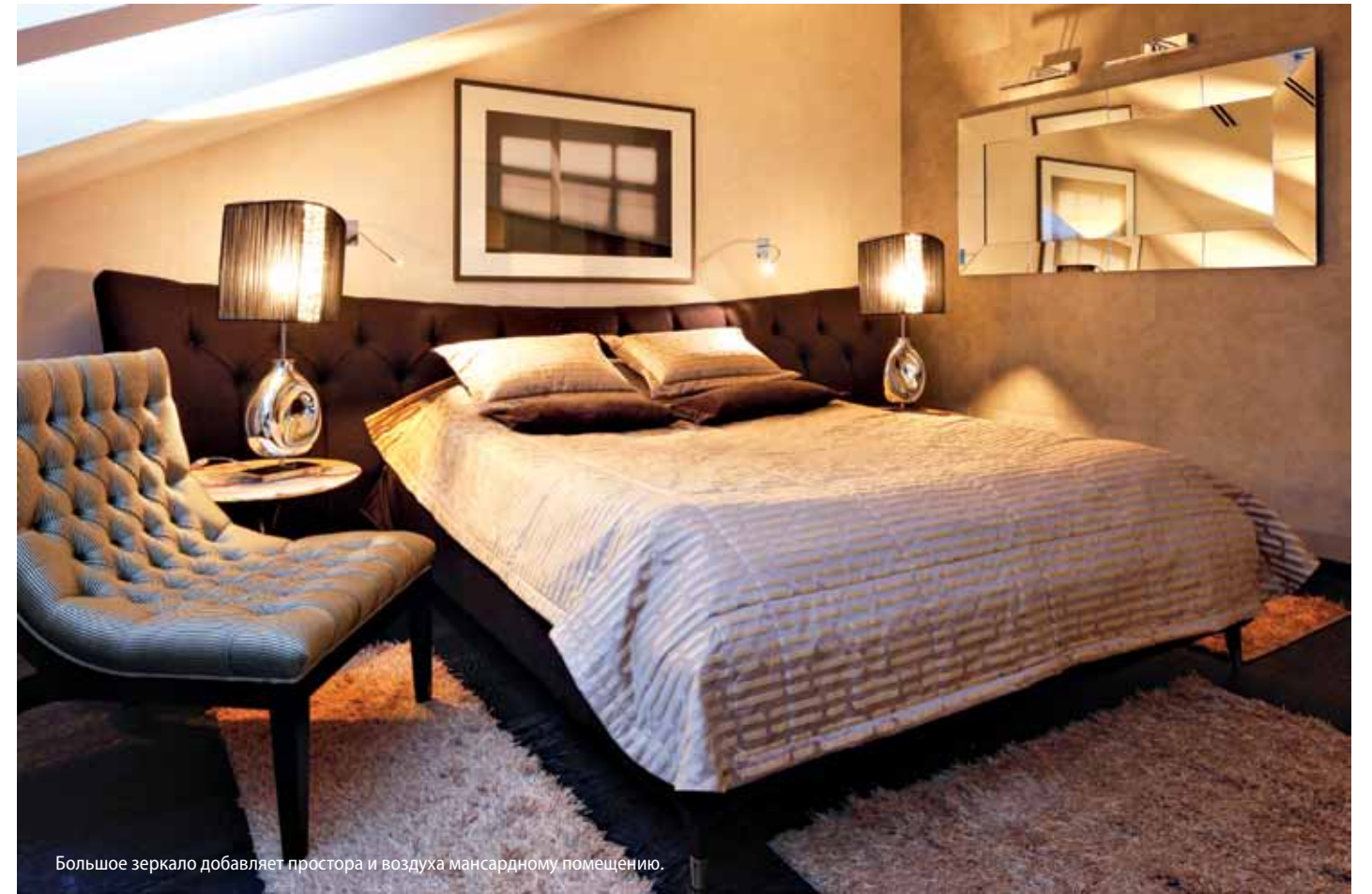
Большое зеркало добавляет простора и воздуха мансардному помещению.