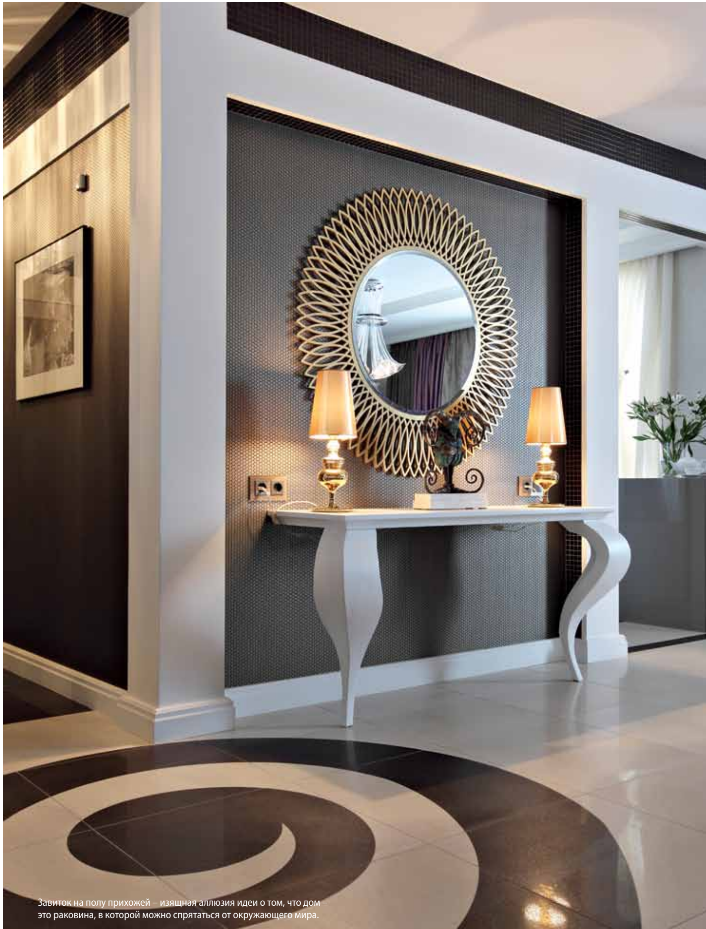
Завиток на полу прихожей – изящная аллюзия идеи о том, что дом – это раковина, в которой можно спрятаться от окружающего мира.