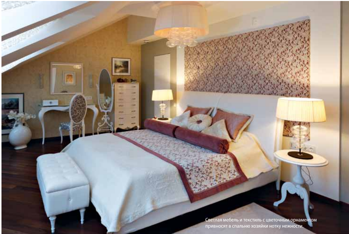
Светлая мебель и текстиль с цветочным орнаментом привносят в спальню хозяйки нотку нежности.