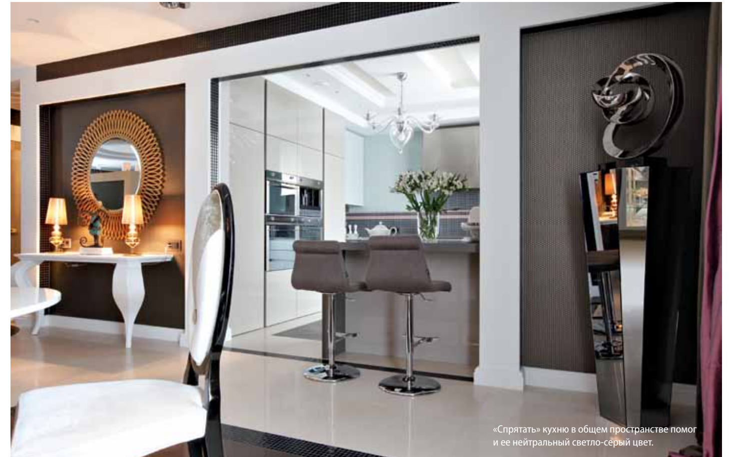
«Спрятать» кухню в общем пространстве помог и ее нейтральный светло-серый цвет.