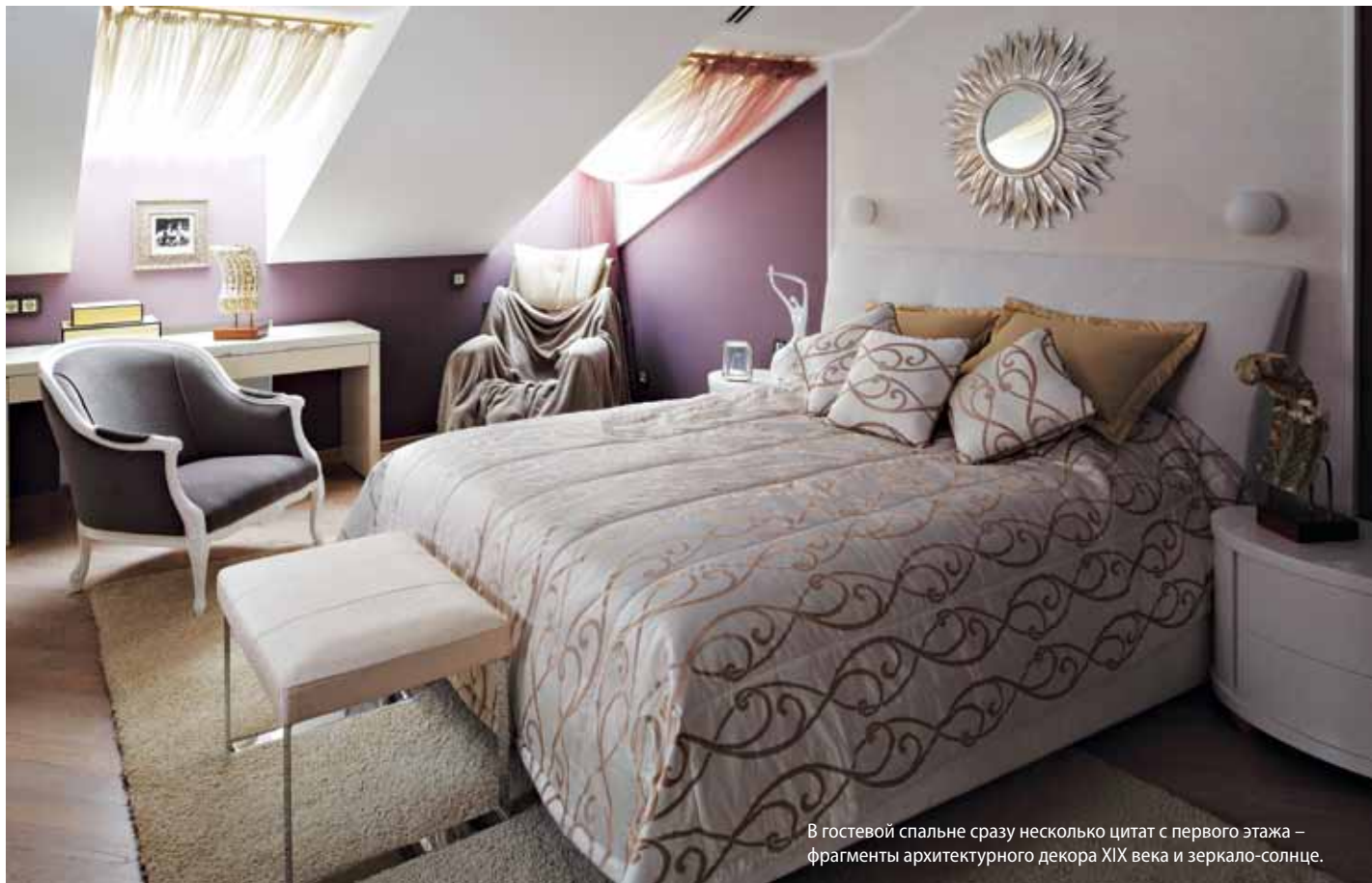
В гостевой спальне сразу несколько цитат с первого этажа – фрагменты архитектурного декора XIX века и зеркало-солнце.