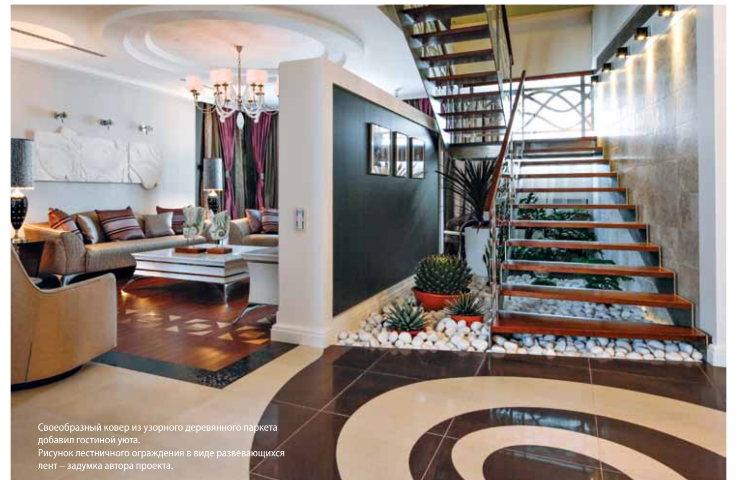
Своеобразный ковер из узорного деревянного паркета добавил гостиной уюта. Рисунок лестничного ограждения в виде развевающихся лент – задумка автора проекта.