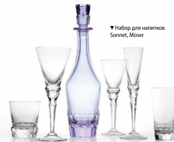
▼ Набор для напитков Sonnet, Moser