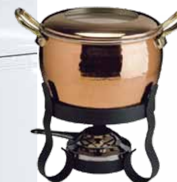
▲ Набор для фондю La Cremeria, Ruffoni