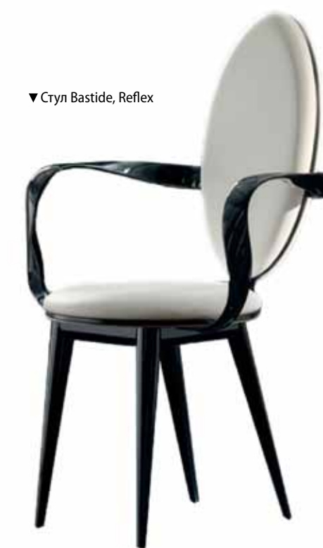
▼ Стул Bastide, Reflex