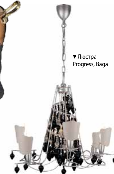
▼ Люстра Progress, Baga